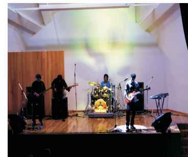
Concierto de Rock: Noesis