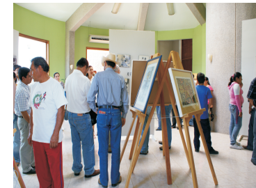
Exposición gráfica y fotográfica

importancia que tiene la reserva de la biosfera Tehuacán Cuicatlán, se contó también con la participación de un poeta mazateco, así como una conferencia acerca de uno de los personajes más representativos de la cultura Mazateca: María Sabina. Además se realizaron presentaciones de Danza, audiciones musicales a cargo de bandas municipales de la región, exposiciones fotográficas, de pintura y artesanías, así como la exhibición de documentales.